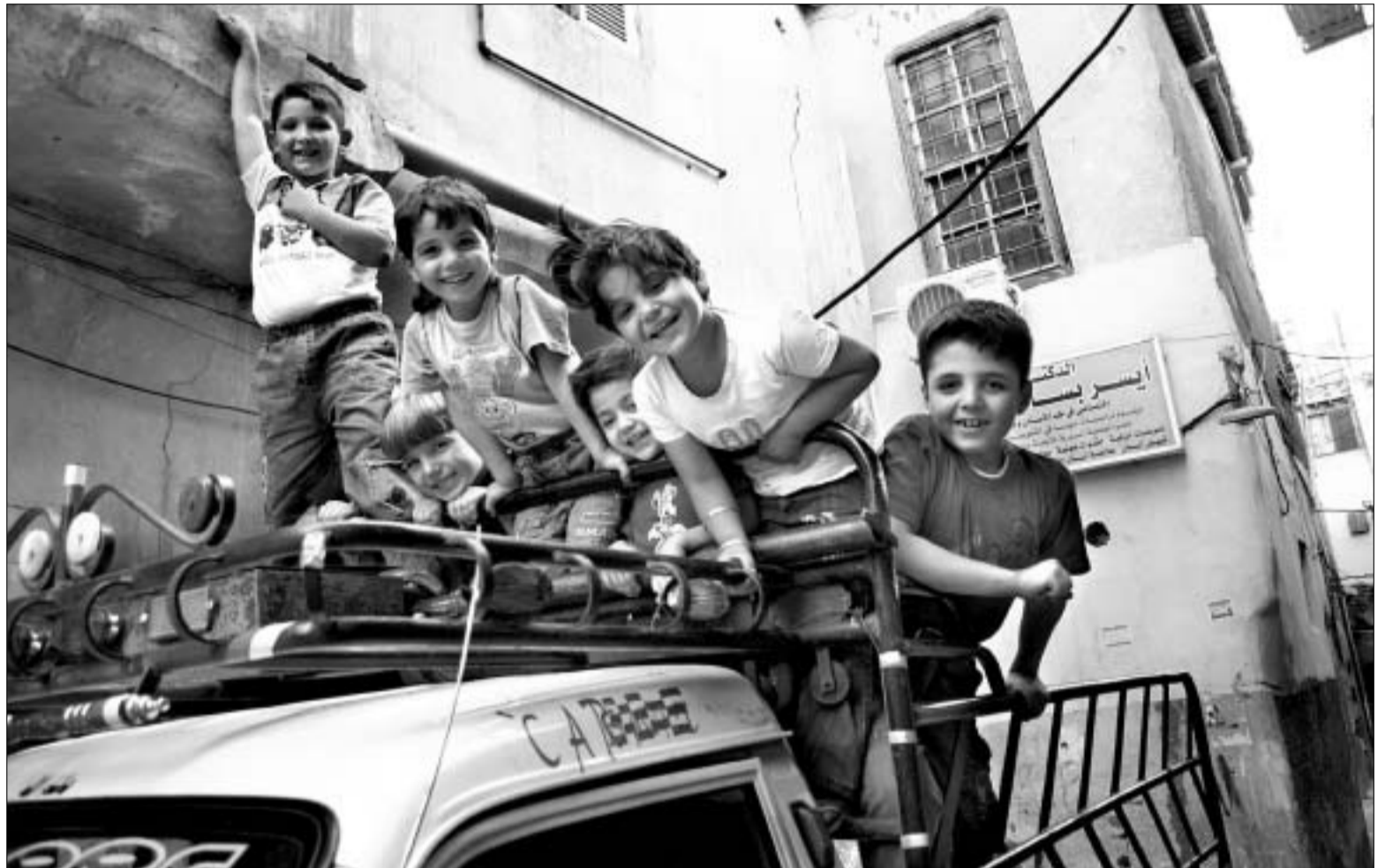
Wojna tuż-tuż, ale Syryjczycy tym się nie przejmują. Jeżdżą jak szaleni w ulicznych korkach, targują się na bazarach.

W mieście porostawiane są też punkty informacyjne. Z głośników na ulicach rozbrzmiewają propagandowe przemówienia i grzmi bojowa muzyka. Ubrany w mundur mężczyzna z uśmiechem pozuje do fotografii, zaprasza też do obejrzenia wystawy. W