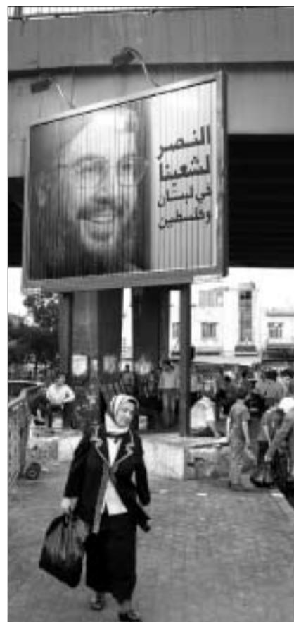
Z plakatów i billboardów uśmiecha się do Syryjczyków przywódca Hezbollahu