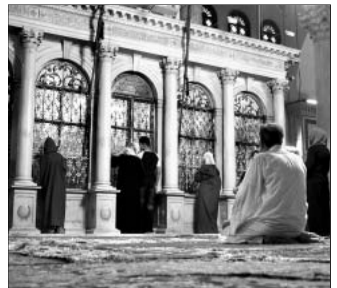
Codzienna modlitwa w meczecie umajjadów...